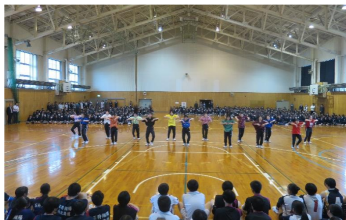
▲華やかなダンスで壮行会を彩るダンス部