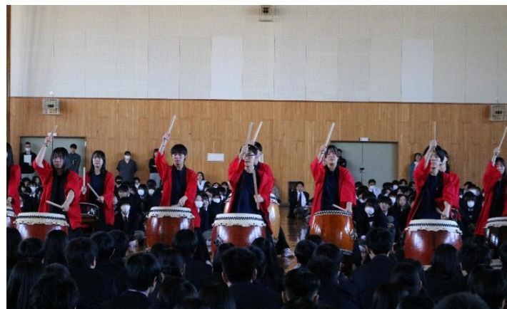
▲迫力ある石狩太鼓局の演奏

4月10日(水)、対面式・部活動紹介が行われました。13の体育会系部活動、15の文化系部活動・外局、生徒会執行部の生徒達が、それぞれの部局の魅力を生徒に様々な趣向を凝らしながら説明をしていました。