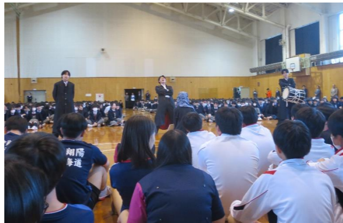
▲声を張り上げエールを送る生徒会執行部