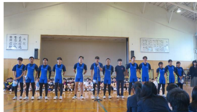
▲大会へ向けて意気込みを語るボート部

5月7日(火) 高体連に向けて、壮行会が開かれ、各部活動大会への意気込みを語りました。大会へ出場する生徒達へのエールとして、ダンス部のダンス披露、生徒会執行部の応援団が登場し、大会へ向けて全校で応援するムードが高まりました。