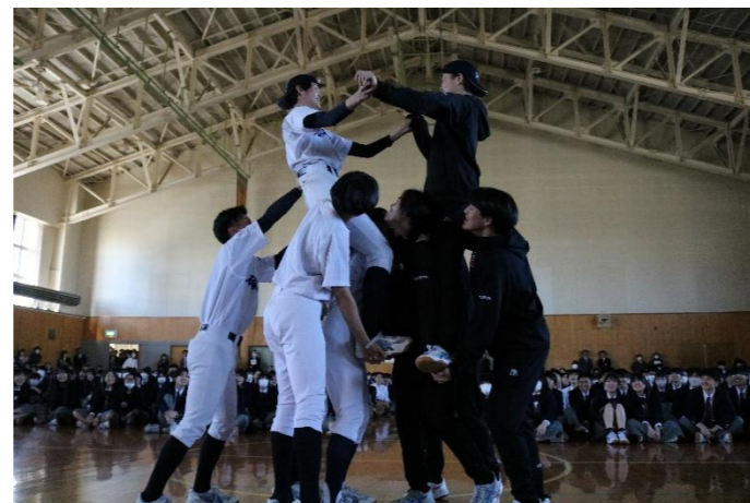
▲公式野球部 vs 男子バスケットボール部の騎馬戦