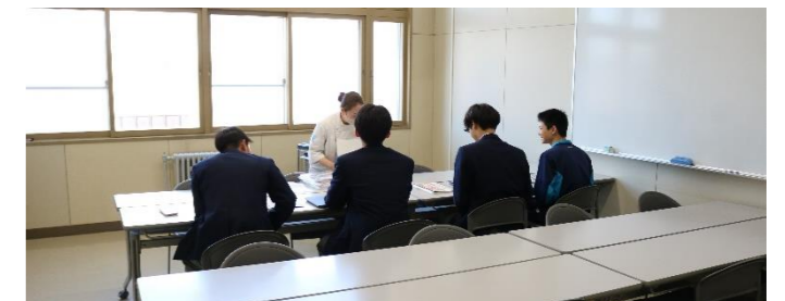
▲3年次課題研究：専門学校の先生にインタビューを行う様子

3年次「課題研究」、2年次「地域研究」(総合的な探究の時間)、1年次「自己を知る活動(ライフプラン)」(産業社会と人間)等、各年次探究的な活動を開始しました。