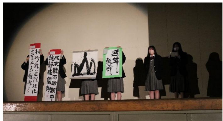
▲書道部の作品紹介